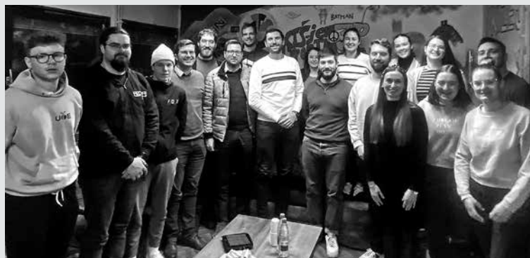
NA SREČANJU Z ODLOČEVALCI SO MLADI DOBILI ODGOVORE in pojasnila za marsikatero problematiko, ki jih je doslej pestila. Predpogoj za to, da se odločevalci zavedajo pomena dela mladih v lokalnem okolju in ga podpirajo, so dobri ter odprti odnosi, ki so jih na srečanju še utrdili.

Na srečanju se nismo mogli izogniti stanovanjski problematiki. Seznanili so nas o stanju stanovanj za mlade v občini, prihodnjih razpisih, ki se navezujejo tako na stanovanja kot na stanovanjske naložbe, časovnici izgradnje novih stanovanj in tem, v kakšnem položaju bomo mladi, ko se bo stanovanja oziroma zemljišča