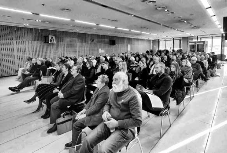
AGENCIJA ZA VARNOST PROMETA JE NA BRDU PRI KRANJU PRIPRAVILA NACIONALNI POSVET OBČINSKIH SVETOV ZA PREVENTIVO IN VZGOJO V CESTNEM PROMETU. Obravnavali so različne teme s področja prometne varnosti, poudarek pa je bil na izvedbi projektov in akcij, ki jih izvaja tudi v sodelovanju z občinskimi SPVCP.

ti na svojem območju. Pri tem smo na Bovškem zelo uspešni, za kar gre zahvala tudi odličnemu sodelovanju SPVCP Občine Bovec z vodstvom OŠ Bovec,« je še dodal.