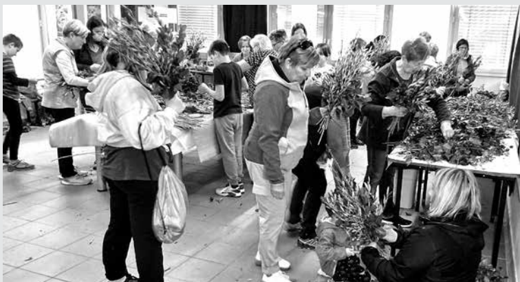
Z DELAVNICO IZDELOVANJA »PUSLOV« v KTT DBD ohranjajo dediščino, ki je od leta 2013 vpisana v Register žive kulturne dediščine Slovenije.

► Tudi letos so člani nabrali vse potrebne sestavine, saj se društvo zaveda, da tako pripravljena delavnica v vsakdanjem hitrem življenjskem utripu predstavlja pomembno prednost pri ohranitvi običaja. Včasih so vse, razen oljke, nabrali v domačem okolju, letos pa so jih morali nekaj poiskati tudi izven meja Baške grape. Jelenjad je osmukala bršljan in obgrizla popke enoletnih leskovih šib, jesenska povodenj je odnesla rumeno