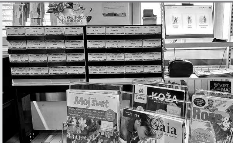
V KNJIŽNICI SEMEN SI LAHKO IZPOSODITE DOMAČA SEMENA , iz katerih vzgojite rastline in pridelate nova semena. Del slednjih nato vrnete v knjižnico in s tem prispevate k ohranjanju lokalnih vrst rastlin.

Tolmin – Že dolgo ni več novost, da je splošna knjižnica veliko več kot le prostor za izposajo knjig. Z željo širjenja znanja in splošnega ozaveščanja o različnih aktualnih temah ustanova sledi zaznamim interesom lokalnega okolja in z bogato zbirko knjižničnega gradiva ter raznolikimi dejavnostmi ustvarja prostor srečevanja in vseživljenjskega učenja. Knjižnica semen je eden od načinov ohranjanja biotske pestrosti kulturnih rastlin, ki temelji na brezplačni izmenjavi semen. Njeno poslanstvo je ozaveščanje o ohranjanju avtohtonih in tradicionalnih vrst rastlin, pa tudi opazovanje na pomen samooskrbe ter spodbuda posameznikom k dejavnemu delovanju znotraj skupnosti in ohraniti lokalne kulturne in naravne dediščine.