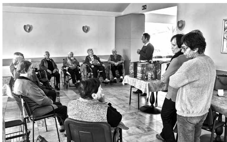
OB KONCU LETA JE BOVŠKI ŽUPAN S PREDSTAVNICAMI Rdečega križa, Karitasa in Društva upokojencev Bovec obiskal Bovčane, ki so nastanjeni v enotah Doma upokojencev Podbrdo.

Največ stanovalcev je v DSO Tolmin. Prijetno druženje v večnamenskem prostoru je popestrilo dan tako uporabnikom kot obiskovalcem. »Vsako leto znova se razveselim, ko vidim, kako dobro skrbijo za vas in kako zadovoljni ste tudi vi z uslužbenci doma. Mi se še vedno trudimo, da bi v Bovcu čim prej zgradili nov dom za ostarele in čeprav se začetek gradnje neprestano zamika, nismo izgubili upanja. Današnji dan sem si vzel zato, da vas skupaj s predstavnicami RK, Karitasa in DU obiščemo in se z vami podružimo, saj vem, da vam naš obisk veliko pomeni,« je ob obisku dejal župan. V imenu vseh jim je zaželel mirne in prijetne praznike, nekaj zabave ob prehodu sta-