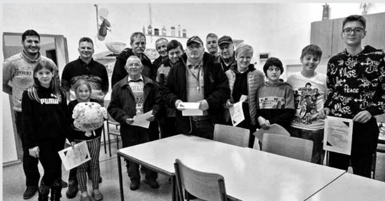
BAŠKOGRAPSKI ŠAHISTI SO V NOVO ŠAHOVSKO LETO vstopili z novoletnim šahovskim turnirjem. V konkurenci je med mladimi nastopilo pet šahistov, pri odraslih pa devet.