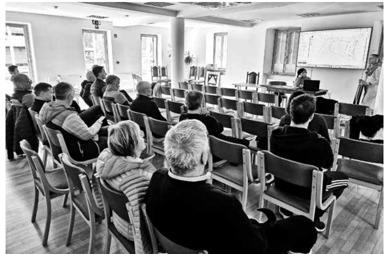
NAČRTE PREUREDBITVE ASFALTNEGA IGRISČA IN VEČNAMENSKEGA IGRISČA OB ŠOLI so zainteresirani javnosti predstavili sredi marca.

Občina Kobarid začneja postopno ureditev športnih površin v športnem