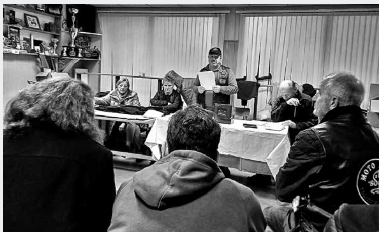
MOTO KLUB SOČA TOLMIN bo nadaljeval z dejavnostmi, ki so zanj že tradicionalne, in vozil po začrtani motoristični poti. Prizadeval pa si bo tudi za prisotnost na nekaterih dogodkih, ki bodo pomembno zaznamovali letošnje dogajanje v občini Tolmin.

gen v Tolminu, uspešno izpeljana moto delavnica in moto avantura. Za prvi maj so poskrbeli za hrumečo prvomajsko budnico, spominu na preminule motoriste so posvetili Čerinov memorial. Odmevne so njihove humanitarne akcije, kot sta obisk pri uporabnikih Varstveno delovnega centra Tolmin in Male hiše v božičnem času.