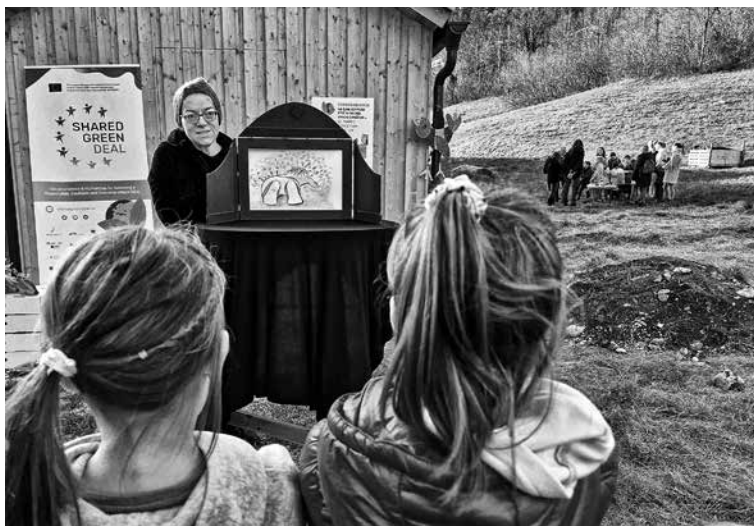
GREGORJEVANJE KOT ZAKLJUČNI DOGODEK ŠTUDIJSKEGA KROŽKA ZA ŠIRŠO JAVNOST – Kulturno-naravoslovni dogodek je na skupnostni vrt Na Logu privabil tako otroke, starše, stare starše kot druge ljubitelje narave.