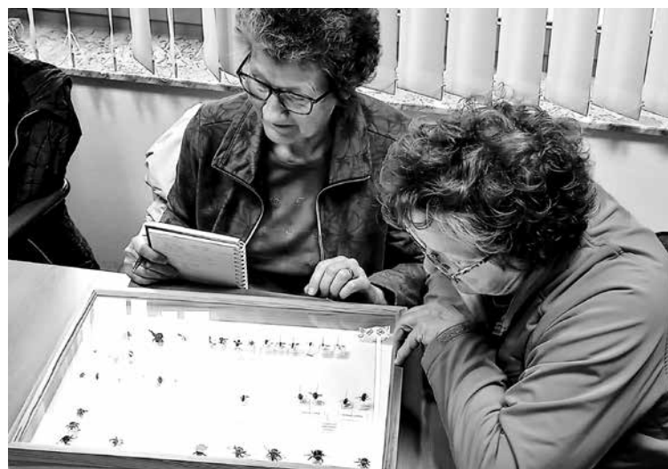
PESTROST SVETA DIVJIH OPRAŠEVALCEV so udeleženci ŠK spoznavali pod vodstvom Nacionalnega inštituta za biologijo.