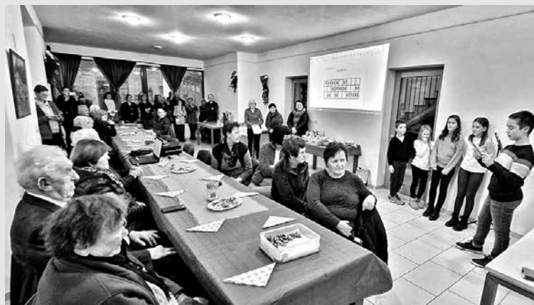
TRADICIONALNO ČAJANKO S TOMBOLO so ob koncu leta za starejše krajanje organizirali v Vodni hiši na Mostu na Soči.