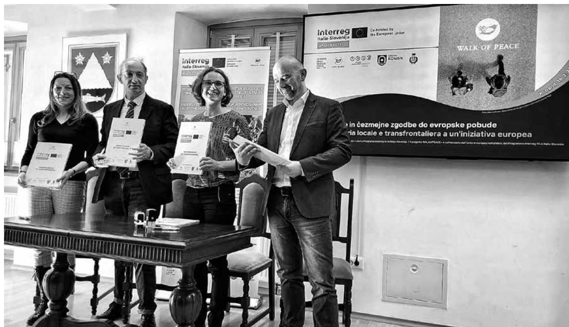
PODPISALI »MEMORANDUM OF UNDERSTANDING« – Sredi februarja je okoli 80 udeležencev iz čezmejnega območja in tudi širše spremljalo podpis sporazuma o čezmejnem sodelovanju pri trajnostnem razvoju in upravljanju Walk of Peace.

To je bil tudi eden od razlogov, da so organizatorji dogodka – fundacija, PRC in Promoturismo FJK v sodelovanju z Občino Kobarid in Kobariškimi muzejem – za kraj srečanja izbrali to naselje ob vznožju Griča sv. Antona. Prav tu in na Krasu se je (tako kot poprej že v FJK in na avstrijskem Koroškem) pred več kot 20 leti začel razvijati slovenski del Poti miru. Ta ideja je od lokalne in čezmejnne poti do danes prerasla v evrop-