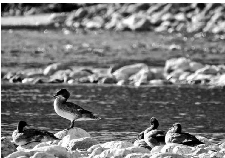
VELIKI ŽAGARJI OB SOČI.

Na evropski ravni v okviru projekta Shared Green Deal poteka 24 družbenih eksperimentov s prioritarnih področij Zelene dogovora. Kot projektni partner je bil Posoški razvojni center vključen v izvajanje enega od štirih eksperimentov na področju ohranjanja biotske raznovrstnosti.