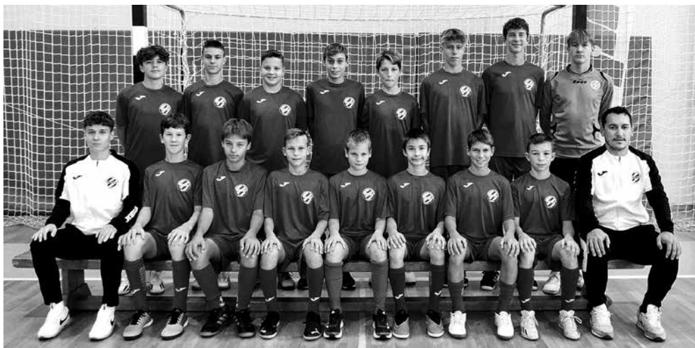
V OPLASTOVI NOGOMETNI ŠOLI V TEJ SEZONI TRENIRA KAR 112 OTROK, prvič se je oblikovala tudi selekcija deklic. Selekcija U15 (na fotografiji) čaka v pomladanskem delu sezone boj za najvišja mesta v futsal prvenstvu.

no odzvali. Prizadevali si bomo za še bolj trdno sodelovanje s starši, iz katerega si želimo pridobiti še kakšnega prostovoljca pri delu z nogometno šolo, saj opravi pri organizaciji tekem ne zmanjka. Zahvaliti se moramo Občini Kobarid za posluš glede dodelitve terminov treningov v telovadnici. Trudimo se za zgledno sodelovanje z različnimi društvi. Še posebej moramo poudariti dobro sodelovanje s Tekaškim klubom Kobarid , ki nam nemalokrat ustrezne pri uporabi površin za trening.