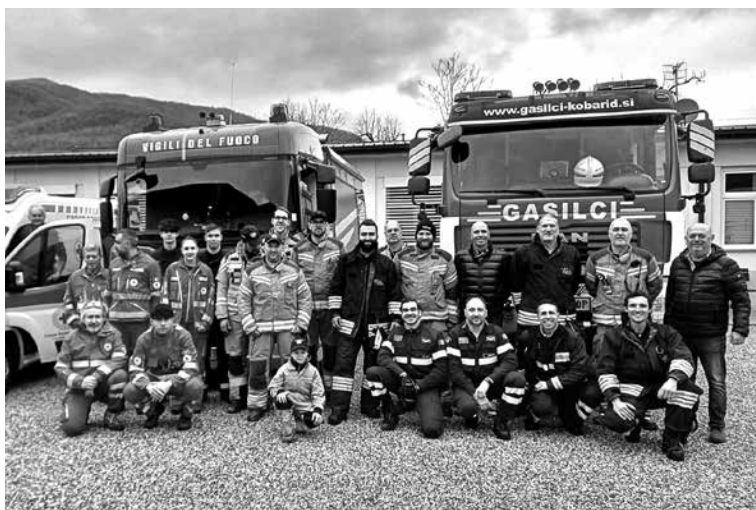
V ZAČETKU MARCA JE NA ŠPETRSKI ŠOLI POTEKAL DAN VARNOSTI , na katerem so sodelovali tudi člani slovenskih služb, ki se ukvarjajo z zaščito in reševanjem. Cilj dogodka je, da mladi spoznajo pomen varnosti v šoli in zunaj nje.

Obiskovalci so z nakupom vstopnic prispevali sredstva v dobrodelni namen, občinski svetniki pa so se za dober namen odpovedali sejnini. Ob-