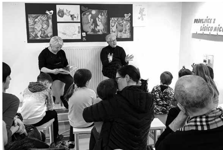
BENEŠKI DNEVI SO SE LETOS PONOVNO VRNILI V KOBARID. Tridnevni kulturni program se je zaključil v tamkajšnji knjižnici s pripovedovanjem beneških pravljic, namenjenih najmlajšim poslušalcem.