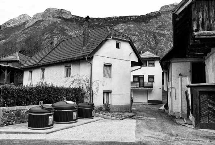
KONEC LETA 2023 SO POTOPNE ZABOJNIKE ZA ODPADKE POSTAVILI TUDI V DVORU. Linijska postavitev omogoča lažje urejanje otoka, barvno kodiranje pokrovov posameznih frakcij in namensko izdelane odprtine zabojnikov pa lažje ter pravilnejše ločevanje odpadkov.

delih, nižjimi cenami izvajalca, pa tudi z nekoliko manjšimi posodami kot na Remontu, je končna cena nižja, in sicer 25.414,75 evra (z DDV).