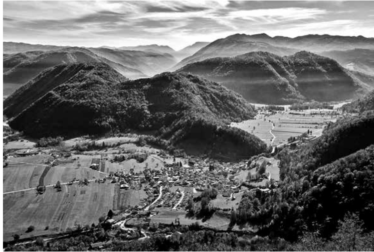
INFRASTRUKTURNA MINISTRICA JE PODPISALA SKLEP O POTRĐITVI ŠTUDIJE VARIANT/PREDINVESTICIJSKE ZASNOVE ZA OBVOZNIČO VOLČE. S tem je odobrena izdelava nadaljnje investicijske dokumentacije.

Ministrica za infrastrukturo Alenka Bratušek je podpisala sklep o potrditvi študije variant/predinvesticijske zasnove za obvoznico Volče. Dokument, ki ga je izdelalo podjetje