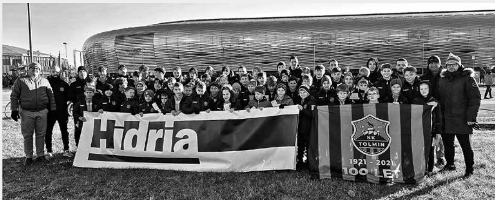
MLADI NOGOMETAŠI IZ NOGOMETNE ŠOLE HIDRIA TOLMIN , ki deluje v okviru Nogometnega kluba Tolmin, so tudi med zimsko sezono nadaljevali s svojimi dejavnostmi.