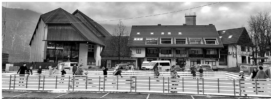
DOBER OBISK DRSALIŠČA, KI JE V BOVCU POPESTRILTO LETOŠNJO ZIMO, potrjuje, da je bila odločitev zanj prava.

Letos je bilo v Bovcu ponovno postavljeno drsališče, za brezplačno uporabo pa je bilo odprto od prve polovice decembra do konca februarja. Za razliko od nekaterih prejšnjih poskusov, ko je v Bovcu že delovalo tudi pokrito drsališče, obisk pa zelo klavrn, je bil tokrat presenetljivo dober. To potrjuje, da je bila odločitev Občine Bovec za postavitev prava. V sodelovanju z Javnim zavodom za turizem Dolina Soče in Športnim centrom Hotel Soča , kjer si je bilo mogoče izposoditi tudi drsalke, je bilo drsališče odprto vsak dan, več-