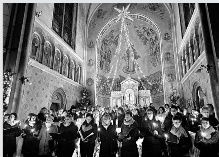
IZ DREŽNIŠKE CERKVE SO SE TUDI LETOS RAZLEGALE BOŽIČNE PESMI . Udeleženi zbori so ob soju sveč zapeli Sveto noč.

Čudovit izbor božičnih pesmi, ki so se prepletale s povezovalnim besedilom, so s svojim bogatim sporočilom o miru, sreči, upanju ... ogrela srca poslušalcev in nas popeljala v čarobni svet zimskega večera. Verjetno si je prav vsak udeleženec