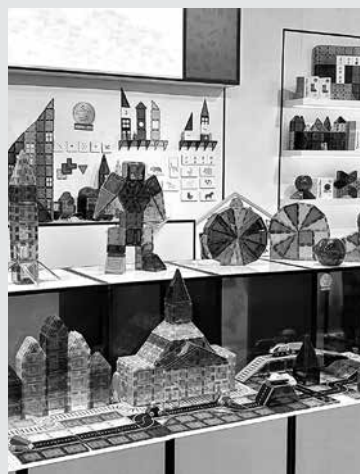
VZGOJITELJI IZ RAZLIČNIH SLOVENSКИH VRTCEV so se v začetku februarja udeležili dvodnevne strokovne izobraževanja z ogledom katoliškega vrtca v Ingolstadtu in obiska sejma igrač v Nurnbergu.

Ingolstadt in Nurnberg (Nemčija) – V začetku februarja sem se avtorica prispevka na pobudo ravnateljice