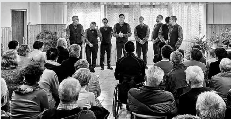
DAN ŽENA, MATERINSKI DAN IN DAN MUČENIKOV so v Hudajužni počastili z nastopom Vokalne skupine Snežet. Tudi tokrat je slovenska narodna in dalmatinska pesem priljubljena skupine kar prehitro minila.

► prelep pomladni mesec marec obarvan s kar tremi prazniki, ki so namenjeni enim in drugim. Tako je bil tudi glasbeni nastop gostujoče pevske