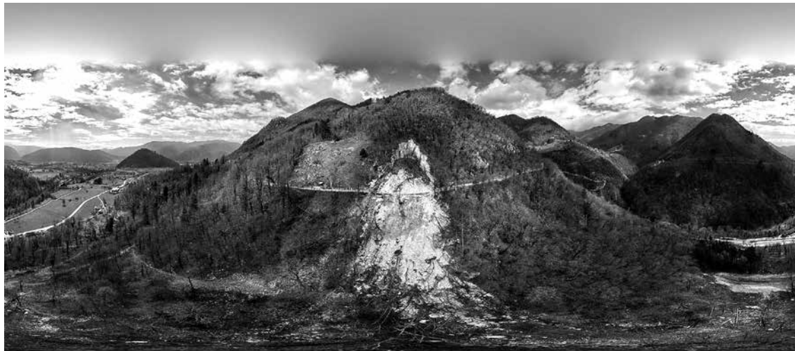
Z IZREDNO STRMEGA POBOČJA NAD LOKALNO CESTO ZATOLMIN-PLANINA POLOG je proti dolini Tolminke zgrmelo okoli 10.000 kubičnih metrov materiala. Zahtevna sanacija je v teku, dela pa naj bi bila zaključena do 8. junija.

Pogodbeni rok za izvedbo zahtevne sanacije skalnega podora, ki je zasul lokalno cesto iz Zatolmina proti planini Polog in terjal tudi človeško življenje, je 8. junij. Kot je ocenil geolog Jože Janež , ki si je plazišče v spremstvu poveljnika občinskega štaba civilne zaščite (OŠCZ) Mihe Venclja ter predstavnikov občine in komunalnega podjetja ogledal večkrat, je z izredno strmega pobočja zgrmelo okoli 10.000 kubičnih metrov materiala. Morebitno nadaljnje drsenje skalnih gmot in zemljine je sprva ogrožalo tudi nižje ležečo cesto v Čadrg oziroma parkirišče pred vstopom v Tolminska korita in tamkajšnji gostinski objekt, kar je v prvih dneh terjalo njuno zaprtje. V tem času so namreč geologi opravili prve simulacije padanja kamenja in na njihovi podlagi določili območje ogroženosti pod podorom. Zavarovanje tega območja je bilo ključno za prvo fazo sanacije.