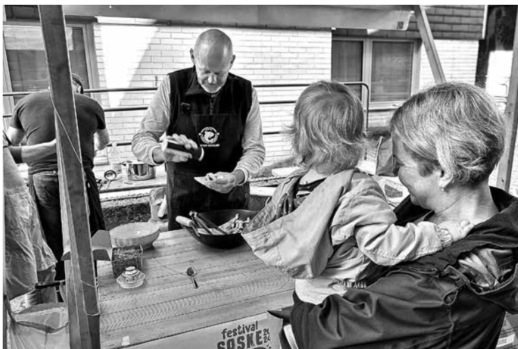
OSREDNJI DOGODEK LETOŠNJEGA FESTIVALA SOŠKE POSTRVI za širšo javnost je bila Ribja tržnica. Na sobotno dopoldne so se v središču Tolmina predstavili lokalni ponudniki z ribjimi izdelki, v kulinaričnem delu programa pa so lahko obiskovalci spremljali prikaz priprave nekaj ribjih jedi.

v čistilni napravi vrne nazaj v vodotok. Vezano na letošnjo temo svetovnega dneva vodá »Voda za mir« in dejstvo, da je vodni vir lahko tudi potencialni povod za konflikt(e), se je razprava v nadaljevanju osredotočila na pomen odgovornega ravnanja, dobrega sodelovanja in usklajevanja, da je oziroma bo vode tudi v prihodnje za vse dovolj. Občina Tolmin je 5. aprila v Vodni hiši na Mostu na Soči predstavila projekt Ureditev vstopnih točk ob jezeru , v okviru katerega načrtuje ureditev treh točk ob mostarskem jezeru, pri čemer bo vsaka od določene mere ureditveno prilagojena specifični skupini uporabnikov jezera. Sledila sta seznanitev z upravljanjem primerljivih jezer v Sloveniji in posvet o upravljanju mostar-