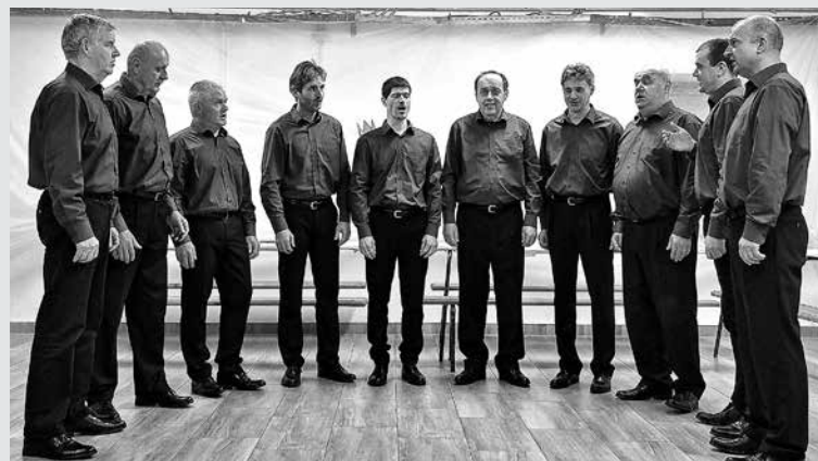
NA IDRJI PRI BAČI SO TUDI LETOS OBELEŽILI 8. MAREC IN DAN MUČENIKOV. Praznovanje, ki je bilo namenjeno vsem generacijam, so zaključili z željo, da srečanje krajanov postane tradicionalno.

Idrija pri Bači – Na Idriji pri Bači smo v soboto, 9. marca, dan zatem, ko smo praznovali ženske in dan pred dnevom, ko imajo svoj dan moški, praznovali. V Domu krajanov ali Kajži, kot stavbo imenujemo domačini, so otroci skozi predstavo in delavnico spoznali Kobilico Milico, večer pa je bil namenjen odraslim in kulturno-zabavnemu programu. Ub-rano petje domače pevske skupine Kresn' smo nagradili z bučnimi aplavzi in se nasmejali skeču »Skregani sosedi« izvedbi Dramske skupine Razor. Druženje ob prigrizkih in kozarčku pa je obogatil srečelov z zanimivimi ter hudomušnimi darili. Vsaka ženska je dobila nageljček, moški pa sladko pozornost. Prizadevni krajanke, ki sta srečanje orga-