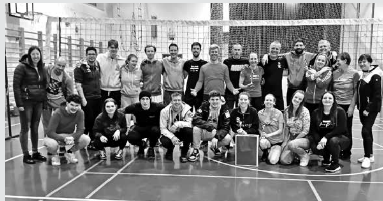
TRADICIONALNI TURNIR V ODBOJKI je zopet dokazal, da je šport dobra priložnost za spoznavanje krajev in kovanje novih poznanstev ter prijateljstev.