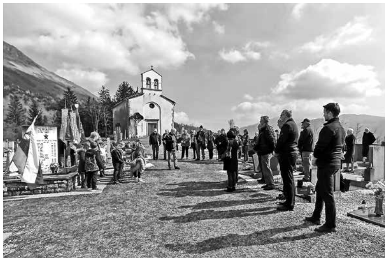
MARCA JE MINILO 80 LET OD POBOJA PRIPADNIKOV BRIŠKO-BENEŠKEGA ODREDA V PLAZEH. Dogodka so se spomnili z žalno slovesnostjo ob spominski grobnici padlim žrtvam na breginjskem pokopališču.