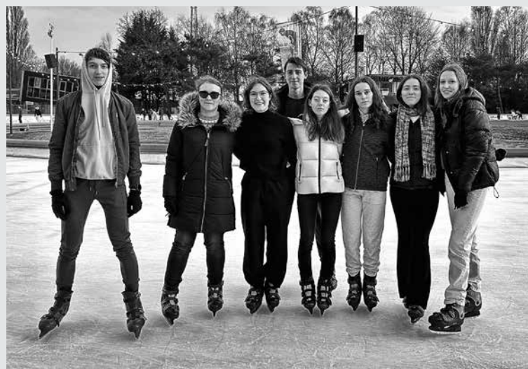
PROJEKT ERASMUS+ ZELENA HARMONIJA: POVEZOVANJE SREČE IN TRAJNOSTI je poskrbel, da je bilo tudi premikanje tolminskih gimnazijcev po Amsterdamu zeleno obarvano. Ob tem gimnazijci že nestrpno pričakujejo ponovno srečanje, ki bo sredi aprila v Tolminu.

Amsterdam (Nizozemska) – Zadnji teden januarja nas je pot prek projekta Erasmus+ vodila v nizozemsko prestolnico, kjer smo se dijaki Gimnazije Tolmin srečali z vrstniki iz Španije in Sicilije. V deželi tulipanov smo pristali v nedeljo popoldne, preosta-