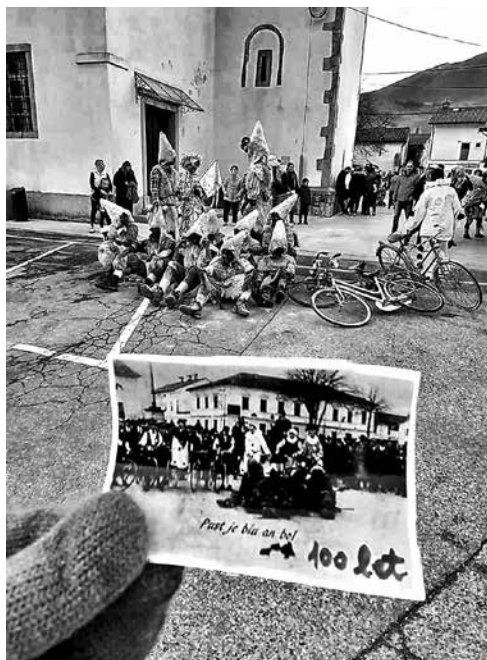
SOURNKI SO LETOS KOBARIŠKI TRG ZASEDLI NA PUSTNI TOREK , saj jim je vreme na pustno soboto preprečilo tradicionalno pustno rajanje.

Sournki so bili nekdanj tudi v vaseh Idrsko, Ladra, Smast, Sužid in Trnovo ob Soči. Po navedbi zbranih virov so sournki oblečeni v stare, največkrat obrnjene hlače in ovčji kožuh, ki jim sega do