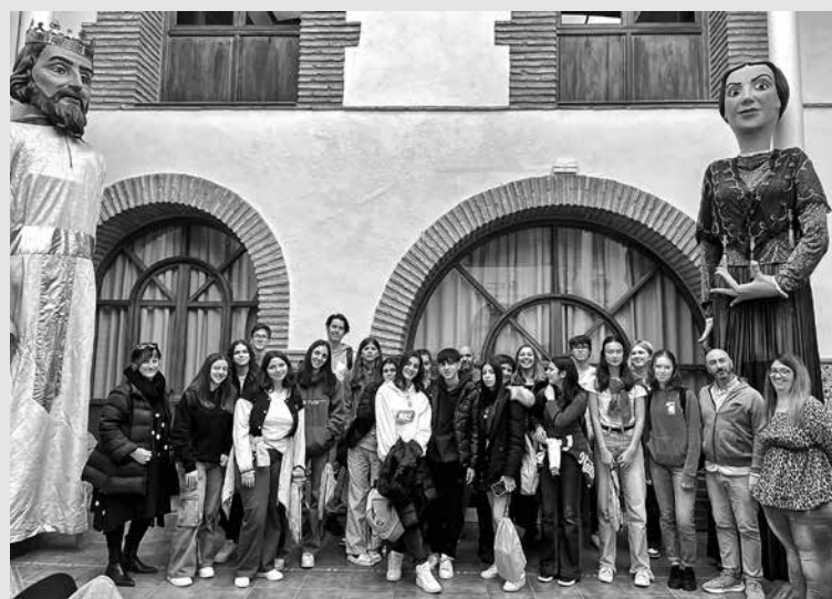
ERASMUS+ JE OSMIM GIMNAZIJCEM OMOGOČIL OBISK ŠPANIJE , kjer so pet dni uživali v soncu in druženju s španskimi ter italijanskimi vrstniki.

Vila-real (Španija) – Erasmus+ je osmim dijakom 2. letnika Gimnazije Tolmin v tem šolskem letu omogočil obisk španskega mesta, kjer smo pet dni uživali v soncu in druženju s španskimi ter italijanskimi vrstniki. Gostitelji s srednje šole IES Broch I Llop so nam predstavili svojo državo, kulturo in hrano, ki smo jo primerjali s slovensko ter italijansko. Njihovo hrano smo lahko tudi pokušali in moram priznati, da je njihova slavna »paella« odlična. Poleg tega