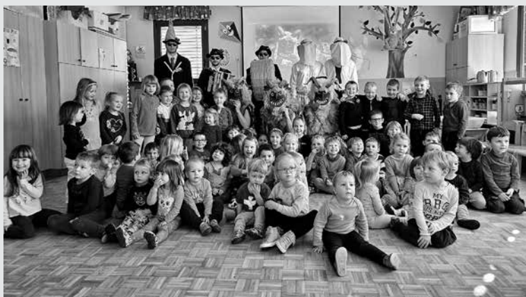
NA ZADNJI JANUARSKI DAN SO VRATA NA STEŽAJ ODPRLI PUSTNEMU VZDUŠJU in v goste sprejeli Ravenski pust, ki velja za enega najstarejših pustovanj na Primorskem.

► torek v vrtec namesto otrok prišle maškare in odganjale zimo, smo pri nas pustnemu vzdušju vrata na stežaj odprli že zadnji dan v januarju, ko nas je obiskal Ravenski pust, ki velja za enega najstarejših pustovanj na Primorskem. Ob zanimivi in doživeti predstavitvi članov fantovščine iz