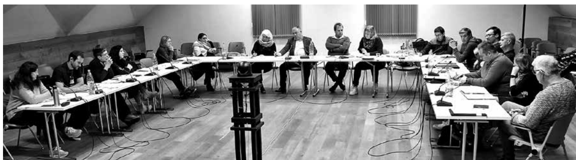
NA DECEMBRSKI IZREDNI SEJI SO BOVŠKI SVETNIKI obravnavali ukrepe za ohranjanje smučišča Kanin.