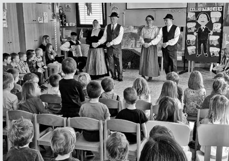
OTROCI MOSTARSKEGA VRTCA SO TUDI V DRUŽBI GOSTOV IZ FOLKLORNE SKUPINE RAZOR ugotavljali, kaj je to kultura.

Ker h kulturi sodijo tudi povesti in pesmi, smo pod drobnogled vzeli našega največjega pesnika Francea Prešerna . Spoznali smo njegovo življenje in dela. Ker pa je kultura tu-