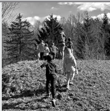
JE SPLOH ŠE KAJ LEPŠEGA, KOT SO BREZSKRBNNE POČITNICE s peštrim dogajanjem v družbi prijateljev? V Mali hiši so otrokom tudi letos pripravili zanimiv zimski počitniški program, ki jih je spodbujal k spontani in sproščeni igri, druženju ter medsebojni komunikaciji.

Prvi dan smo namenili medsebojnemu spoznavanju in ustvarjalni delavnici, na kateri smo izdelovali živali iz odpadnih kartonov. Popoldne smo se sprehodili do labirinta pri Tolminski hiši, kjer smo se nadvse zabavali, do konca dneva pa odigrali še neskončno partij muhc .