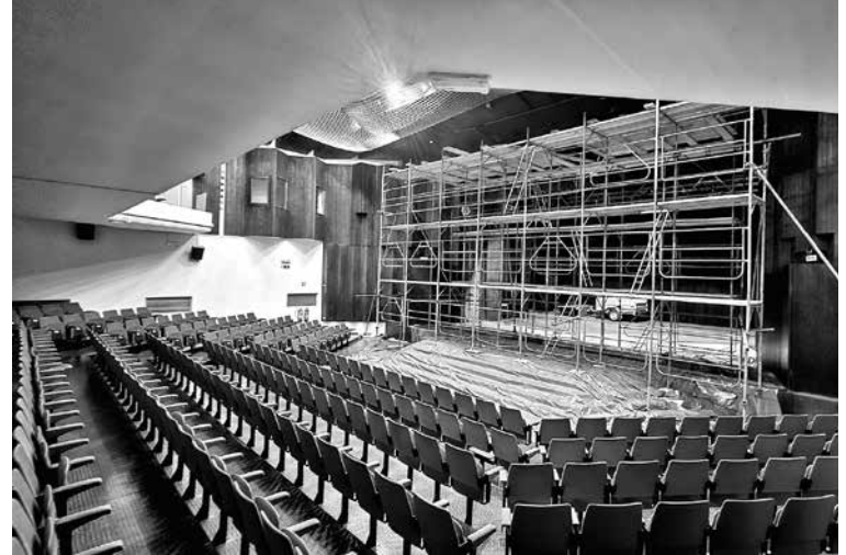
VELIKA DVORANA ITE RINE JE BILA OD AVGUSTA LANI ZAPRTA , saj so bili za odpravo pomanjkljivosti iz preteklosti potrebni večji gradbeni posegi.

Dela je izvajalo podjetje SGP Zidgrad Idrija s podizvajalci in kooperanti.