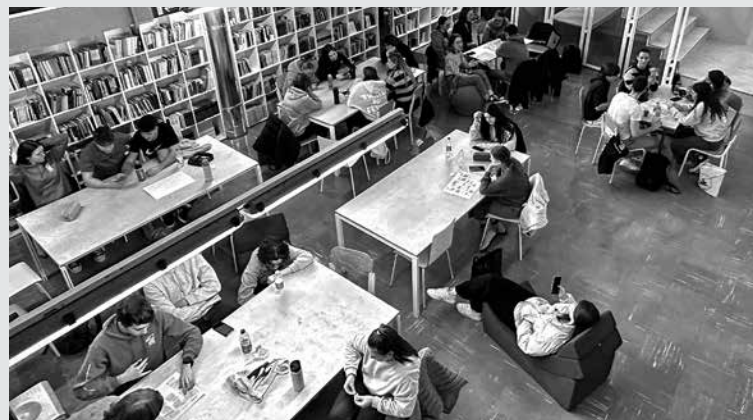
V SKLOPU PROJEKTA STARTUP IZZIV POPRI je letos skupaj sodelovalo devet srednjih šol, med katerimi je bila tudi Gimnazija Tolmin.

V sklopu tridnevnega dogodka se mladi naučijo, kako z metodami vitkega podjetništva tehnološke in družboslovne ideje hitro ter učinkovito spremeniti v uporabne izdelke, storitve in poslovne rešitve. S pridobljenim znanjem so se lahko kasneje prijavili tudi na nacionalno tekmovanje v podjetniških idejah mladih –