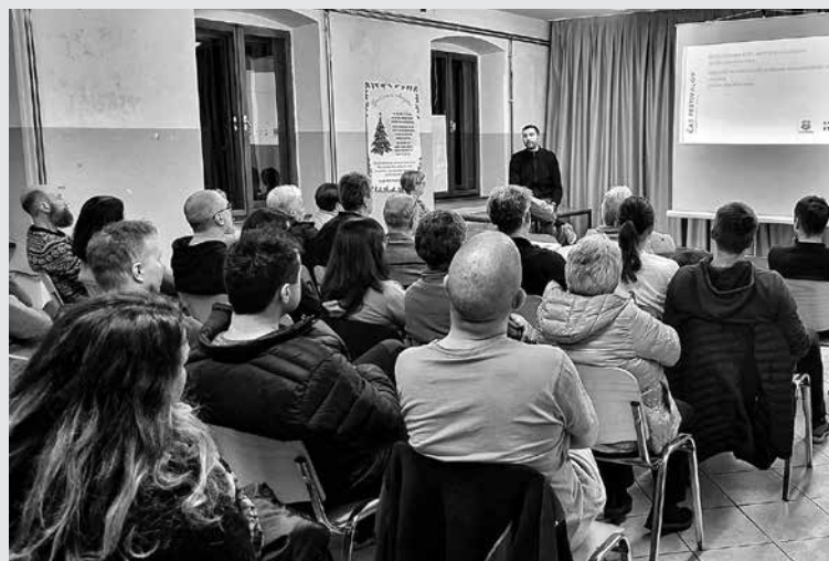
NA ZBORU KRAJANOV SO PREDSTAVILI TUDI NEKAJ NOVOSTI V DELOVANJU KS – Več o tem, kaj vse so člani KS Poljubinj - Prapetno v družbi tolminskega župana in drugih gostov predstavili sokrajanom, si lahko ogledate v predstavitvi na spletni povezavi rb.gy/0s44or , ki so jo naknadno dopolnili za vse, ki se zbora krajanov niso uspeli udeležiti.

žive planine (letos bomo obeležili 150 let prve delujoče mlekarske zadruga na Slovenskem in Furlanskem, ki se je ustanovila prav v Poljubinju);