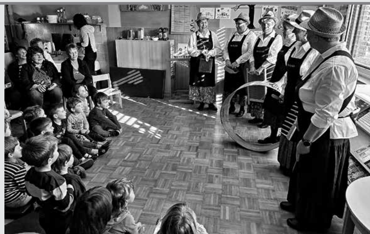
OTROKOM PODMELŠKEGA VRTCA SO NJIHOVE BABICE IN KARIŠKE ČEČE z ljudskimi melodijami pomagale priklicati pomlad.

Besedilo in foto: Špela Krivec , vzgojiteljica, Vrtec Podmelec