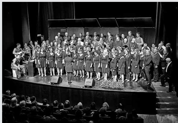
NA REVII PEVSKIH ZBOROV ZGORNJEGA POSOČJA so 3. in 4. februarja nastopili skoraj vsi delujoči pevski sestavi. Oba koncerta so pevci zaključili s skupno pesmijo Tam, kjer sem doma .

Kobarid in Tolmin – V okviru Javnega sklada za kulturne dejavnosti RS (JSKD), ki spodbuja delovanje vseh področij ljubiteljske kulture, se v januarju začnejo območna srečanja, na katerih se lahko predstavijo