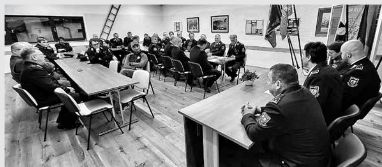
OBČNI ZBOR GZ BOVEC – Delegati so na načelni ravni k začetku postopka za ustanovitev GZ Severnoprimorske podali pozitivno mnenje. Seveda pa bodo morale ta predlog potrditi še ostale GZ iz naše regije.

Srpenica – Sredi marca je v veliki dvorani gasilskega doma potekal Občni zbor Gasilske zveze (GZ) Bovec. Delegati prostovoljnih gasilskih društev (PGD) so najprej izvolili delovno predsedstvo, nato pa so preg-