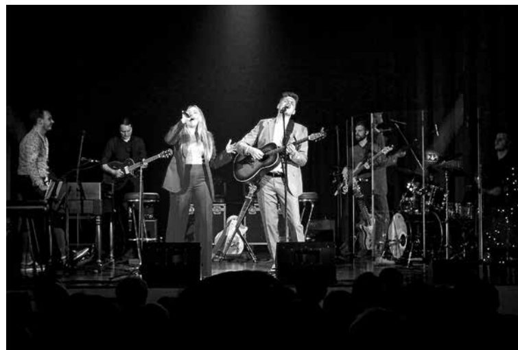
OBČINA KOBARID JE OB KONCU LETA PRIPRAVILA TRADICIONALNI DOBRODELNI KONCERT . Celotni izkupiček – skoraj 4.000 evrov – je nakazala na račun Rdečega križa Tolmin , donacija pa namenila prizadetim v lanskoletnih ujmah.