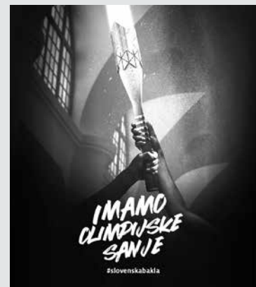
SLOVENSKA BAKLA, KI BO SVOJO POT ZAČELA STO DNI PRED ZAČETKOM OLIMPIJSKIH IGER V PARIZU in v 72 dneh obiskala vseh 212 slovenskih občin, se bo po dolini Soče iz rok v roke podajala 31. maja.

Slovenija – Prvo izvedbo slovenske bakle smo v Sloveniji doživeli leta 2021, ko je ta od maja do julija v 82 dneh prepotovala našo državo, obiskala je 211 sodelujočih občin. Baklo je na več kot 7.000 pretečenih kilometrih nosilo več kot 10.000 nosilcev, od tega je sodelovalo 19 dobitnikov olimpijskih kolajn, več kot 500 športnih klubov, več kot 150 županov, več kot 300 otrok in odraslih s