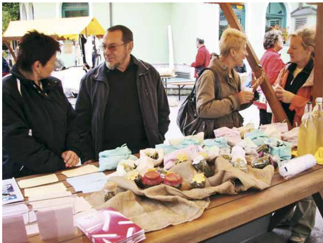
Slika 1: Predstavitev zelišč na sadjarskem sejmu v Tolminu (2009).

Odrasli, ki jih je zanimala tovrstna tematika, so se srečevali v okviru študijskega krožka Rož'ce z okusom, ki je bil izveden leta 2009. Spoznavali so posamezna zelišča in začimbnice ter širok spekter njihove uporabnosti, ki jim je razširil obzorja za samostojno učenje. Izbor zelišč, tako tistih, ki jih lahko gojimo v svojih zelenjavnih in zeliščnih vrtovih, kot samoniklih, ki jih nabiramo v naravi, je izhajal iz trenutnega znanja udeležencev, njihovih izkušenj pri uporabi in lažšanju lastnih težav. V času srečanj je bilo zapisanih in zbranih veliko receptur za izboljšanje imunskega sistema, pripravo raznovrstnih začimbnih mešanic, lepoutilnih pripravkov in podobno. Tudi male skrivnosti, ki si jih