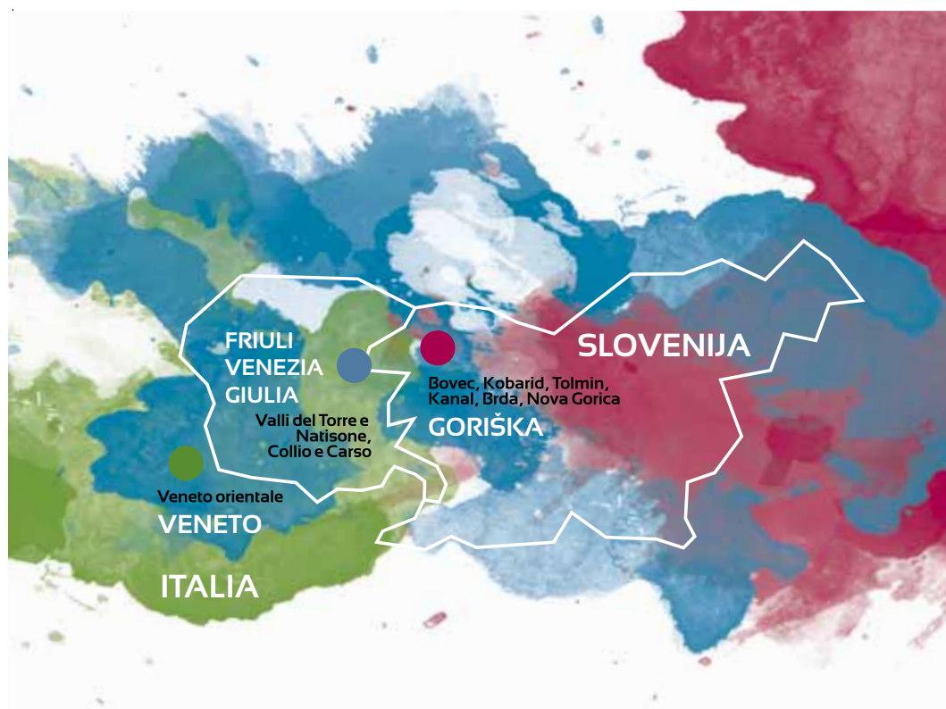
Karta 1: Območje izvajanja projekta.

Glede na geografske, demografske in ekonomske značilnosti so si omenjena območja med seboj tako podobna kot tudi različna.