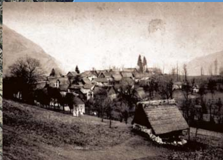
Na fotografijah: del kamnitega mostu v kraju Idrija pri Bači pogled na vas Vrsno s hišami, pokritimi s slamo

Ljudje v alpskem prostoru so se morali prilagoditi podnebnim in drugim geografskim razmeram, da so lahko preživali. Gradbena znanja, veščine, materiali ..., ki so jih razvijali skozi stoletja, so nam danes še dostopni. Če jih želimo ohraniti, uporabljati in razvijati tudi v prihodnje, jih moramo uskladiti z izzivi trajnosti in potrebami današnjih prebivalcev tega prostora.